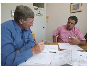
Während einer Lektion

im Kursgeld inbegriffen im Kursgeld inbegriffen eigenes Laptop mitbringen (Verbindungsgebühren an Gastgeber direkt bezahlen)