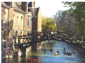
Am Fluss Cam

Cambridge (100'000 Einwohner), zusammen mit Oxford die Universitätsstadt schlechthin, wurde, wie viele englische Städte, von den Römern gegründet als kleine Garnison an einem Übergang des Flusses Cam. Zur Blüte kam der ursprünglich bescheidene Ort im 13. Jh., als einige Studenten nach Querelen mit Einheimischen Oxford fluchtartig verlassen mussten