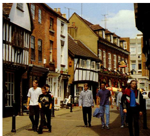
In der Innenstadt

Worcester (95'000 Einwohner) liegt im Zentrum Englands, 40 km südlich von Birmingham. Die grossartige Kathedrale (11.-14. Jh.) dominiert das Stadtbild. In den kleinen alten Gassen, die "Shambles" sind besonders reizvoll, findet man heimelige Pubs und gemütliche Restaurants, in der eleganten Foregate Street unzählige Läden und Warenhäuser. Kulturell ist