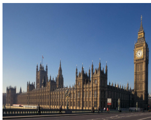
House of Parliament

„Our clients are busy, demanding people. They have no time to waste, and need the best. Our courses have been developed in response to their needs. We offer highly practical training with immediately usable results.“